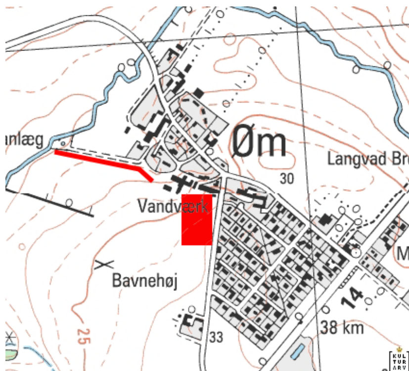
Fig. 1) De udgravede områder, Foldager og Foldager II – undersøgt af Roskilde Museum i henholdsvis foråret og efteråret 2004, er markeret med rødt.

I forbindelse med Lejre Kommunes anlæggelse af spildevandstracé fra byggeriet på Foldager, foretog Roskilde Museum en arkæologisk undersøgelse af de kulturhistoriske spor i tracéet. Undersøgelsen blev i henhold til museumslovens § 27 stk. 4 bekostet af bygherren, Lejre Kommune. Sagen har journalnummer ROM 2265, Foldager II. Dokumentation og arkæologiske fund opbevares på Roskilde Museum.