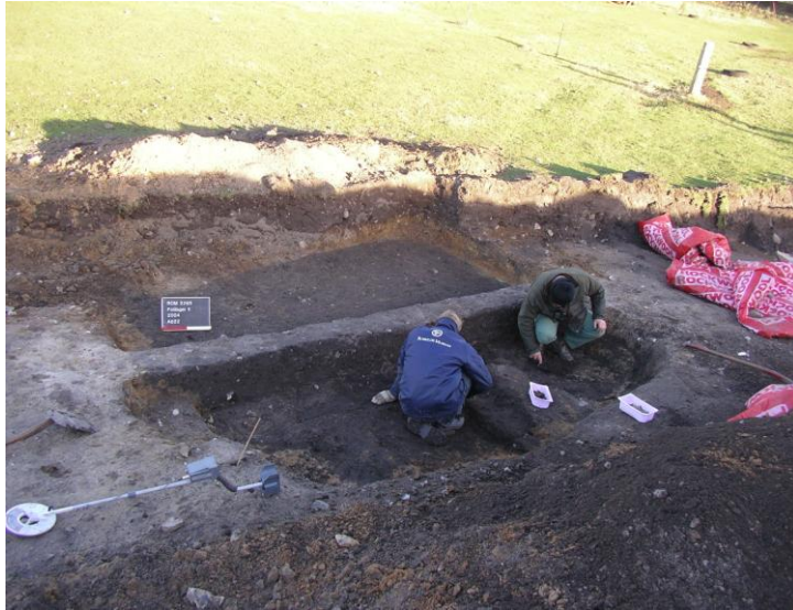
Fig. 3) Arkæolog S.Å. Tornbjerg (t.h.) og museumsmedarbejder N.W. Nielsen i grubehuset. En langsgående jordvæg, en såkaldt balk, er bibeholdt for at kunne følge lagdelingen i huset.