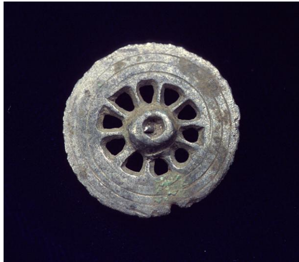
Fig. 6) Hjulformet hængesmykke af sølv. Diameter: 2,2 cm. Fundet med metaldetektor på marken syd for udgravningen.