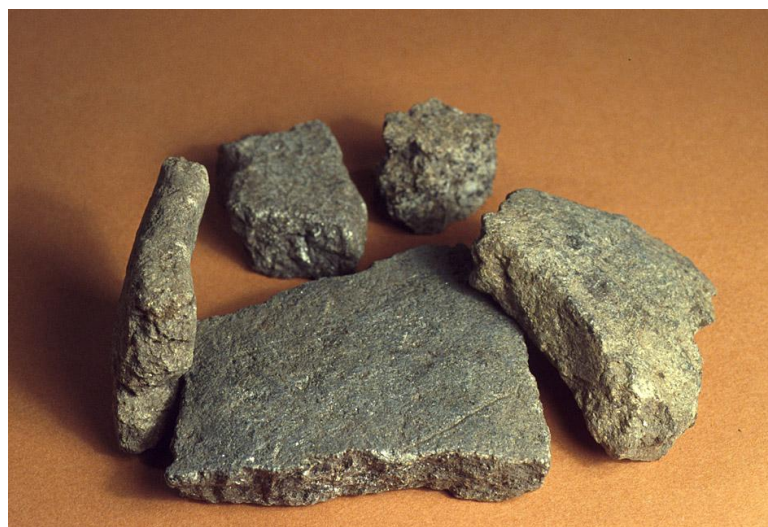
Fig. 7) Skår fra et stort kar af importeret klæbersten. Fundet i grubehuset.