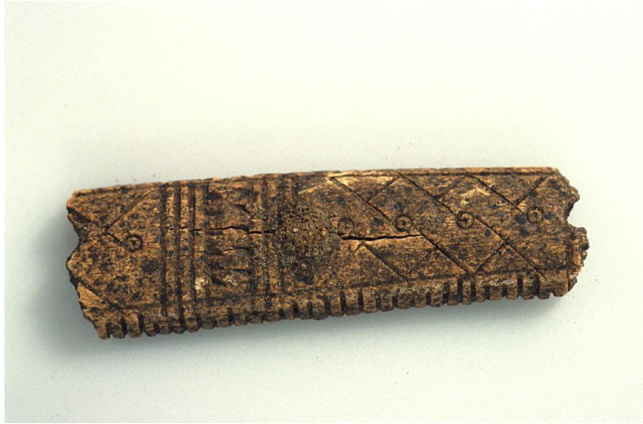
Fig. 5) Fragment af ornamenteret benkam. Længde 5,3 cm. Fundet i grubehuset.