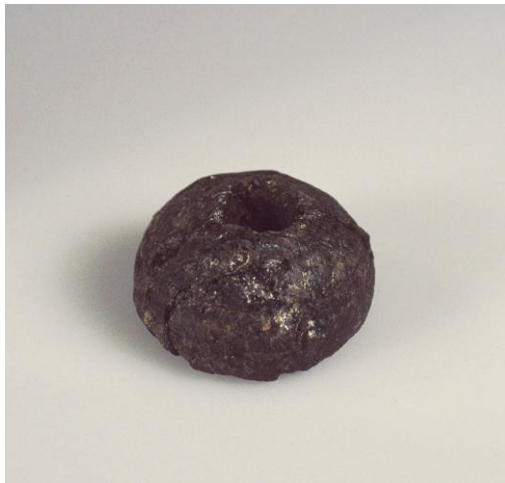
Fig. 4) Bikubeformet ténvægt af importeret klæbersten. Diameter: 3 cm. Fundet i grubehuset.