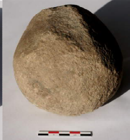
Løber til en skubbekværn fra grube A112, øverst til venstre ses slidspor.