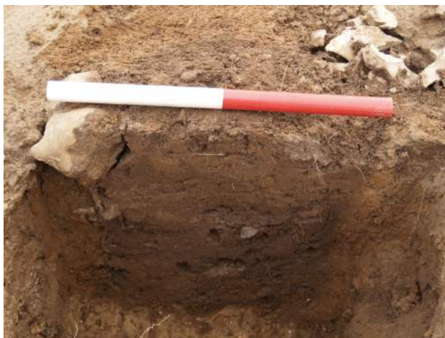
Stolpehul A47, der indeholdt to små stykker tegl.

Stolpehullerne er lyse i fylden og ser ikke ud til at være recente.