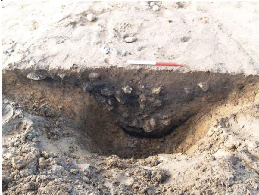
Kogestensgrube A41 med to adskilte lag af ildskørnede sten og trækul.

Datering: Kogestensgruber dateres traditionelt til yngre bronzealder/førromersk jernalder.