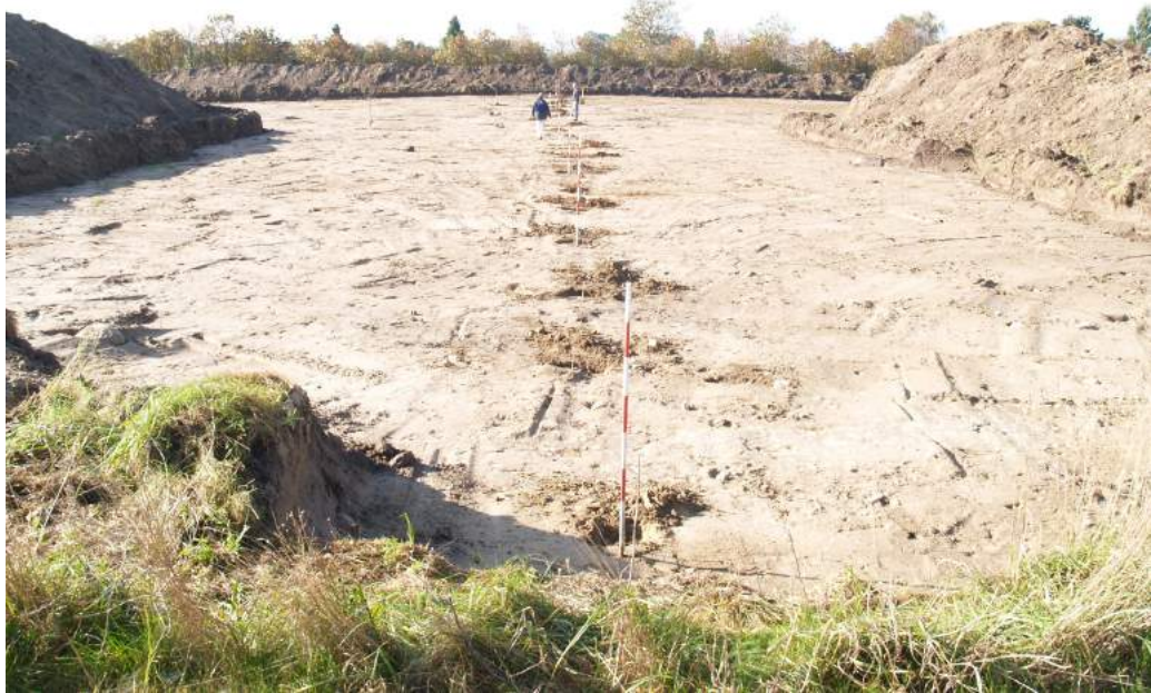
Stolpehullerne i hegnet markeret med landmålerstokke. Hegnet peger lige mod Roskilde Domkirke, der dog ikke kan ses for træerne.

DNN. De er således nogenlunde ens for både de dybt nedgravede og de mindre dybt nedgravede stolpehuller.