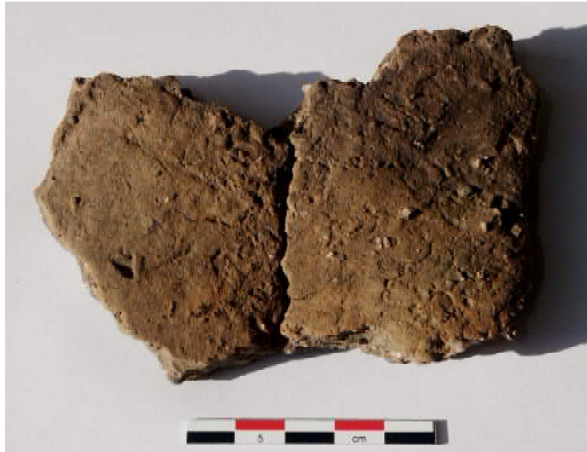
Keramik fra grube A112.