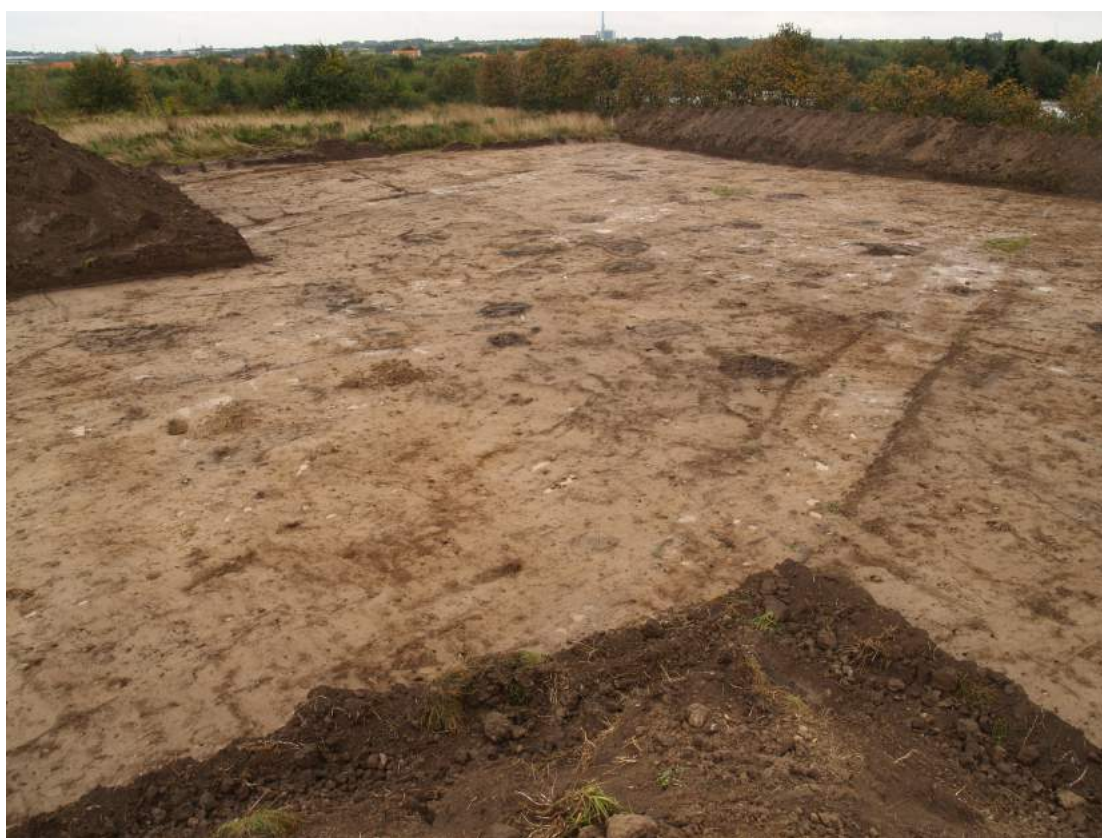
Udgravningsfeltet set fra nord.

Udgravningen blev i henhold til museumslovens § 27 stk. 4. bekostet af bygherre, Roskilde Kommune.