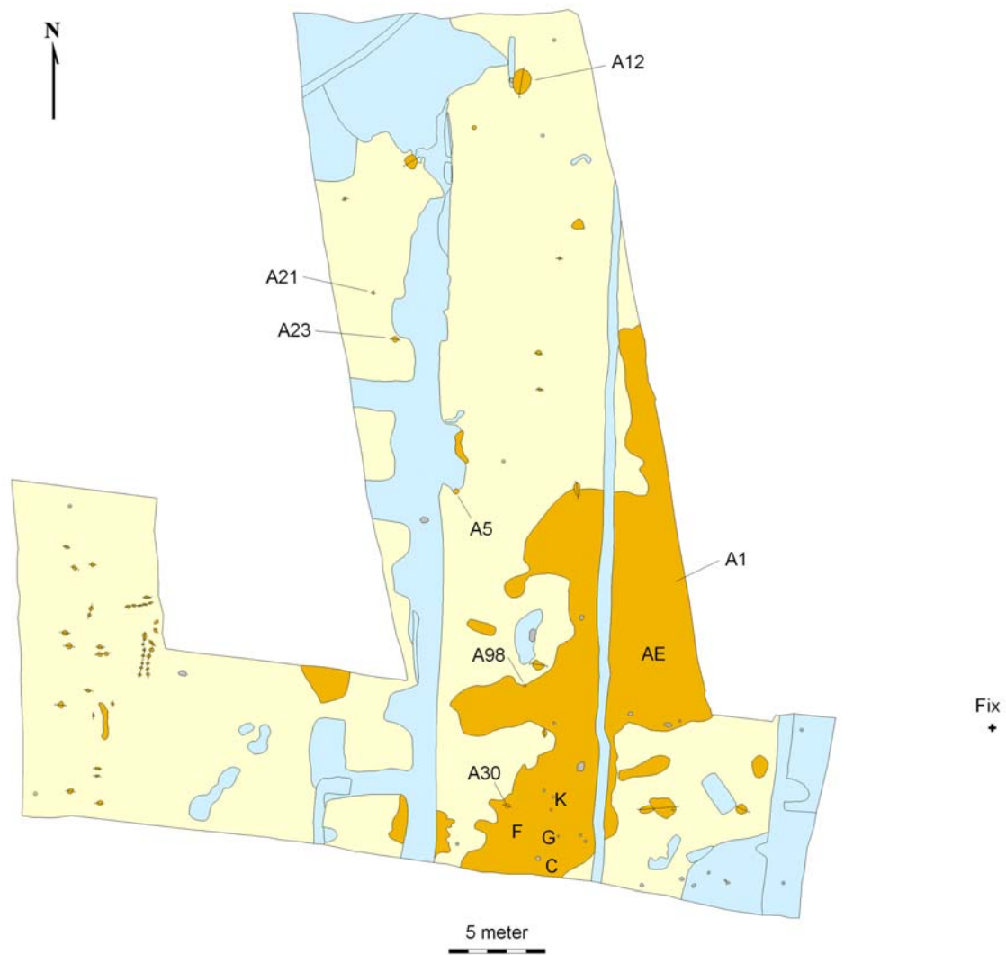
Fig. 3. Plan over udgravningsfeltet med relevante anlæg markeret.