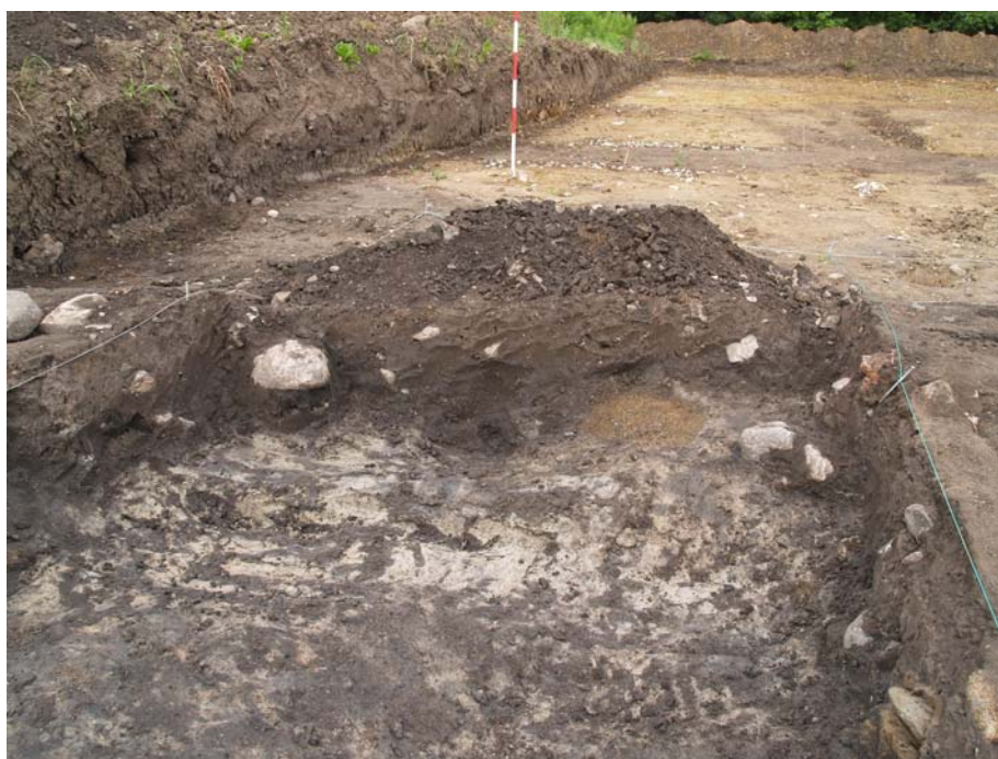
Fig. 4. Anlæg A1 set fra øst, den sydligste del udgravet i bund