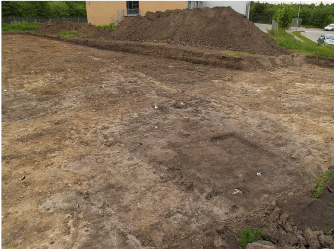
Anlæg A1 set fra sydvest

ROM j.nr. 2381 LANGEBJERGVÆNGET 19 Matr.nr. 57g, Store Hede Roskilde sogn, Sømme herred, Københavns amt Stednr. 020410-136