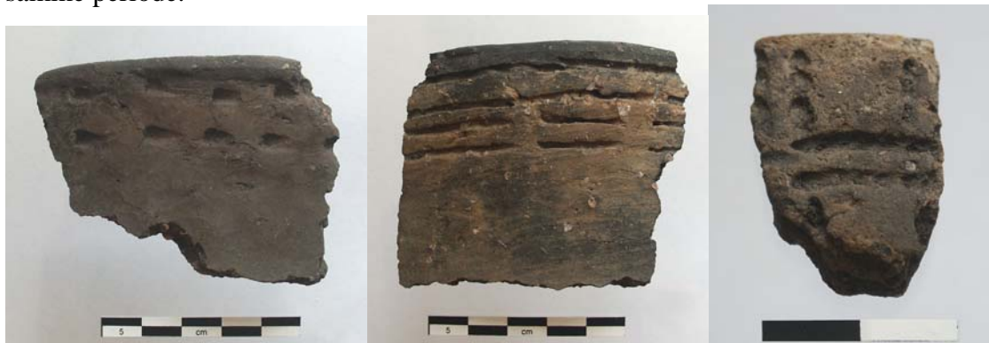
Fig. 5. Keramik fra anlæg A1: Randskår fra tragtbægre med dekoration af hhv. pindstik (tv.) og furestik (mf.) lige under randen. Th. randskår dekoreret med 2-snoet snor.

Der er intet i fundmaterialets sammensætning eller placering, der tyder på, at fundene skulle være rester efter offerned sættelser, sådan som man kender det andre steder fra i samme periode.