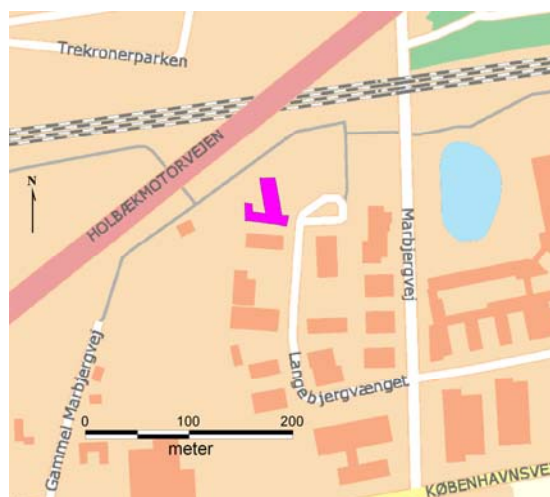
Fig. 2. Udgravningsfeltets placering i lokalområdet.

Muldykkelsen varierede fra 0,3-0,8m. Den store forskel skyldes både moderne nedgravninger af kloak, dræn m.v., aflæsning af jord og almindelig udjævning af grunden. Undergrunden bestod af gulbrunt sandet iblandet en del sten; mest leret i den østlige del af feltet, mens den vestlige del var mere sandet. I den nordligste og vestligste del af feltet, hvor muldlaget var tyndest, var undergrunden meget forstyrret af rødderne fra den tidligere beplantning.