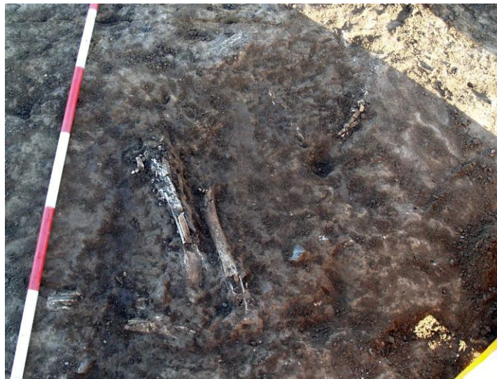
Grav A 504. de bøjede ben ses nederste, øverst rester af bøjede arme.

Den stærkt afpløjede grav var orienteret omtrent NV-SØ. Gravens oprindelige størrelse kan vanskelig anslås, måske ca. 90x130 cm. I den sydlige ende er gravfylden afgrænset indenfor en rundet nedgravning; kun hér fandtes porøse fragmenter af skeletdele in situ. I området nord og vest for skeletdelene sås et vanskeligt afgrænset område med pletter af gravfyld, i nord med brede tydelige nærmest øst-vest gående nyere pløjesor, hvori der også sås stumper af knogler. Det er tydeligt at afpløjningen er foregået fra øst mod vest, hvorved knoglestumper samt fyld er trukket ud mod vest og nordvest..