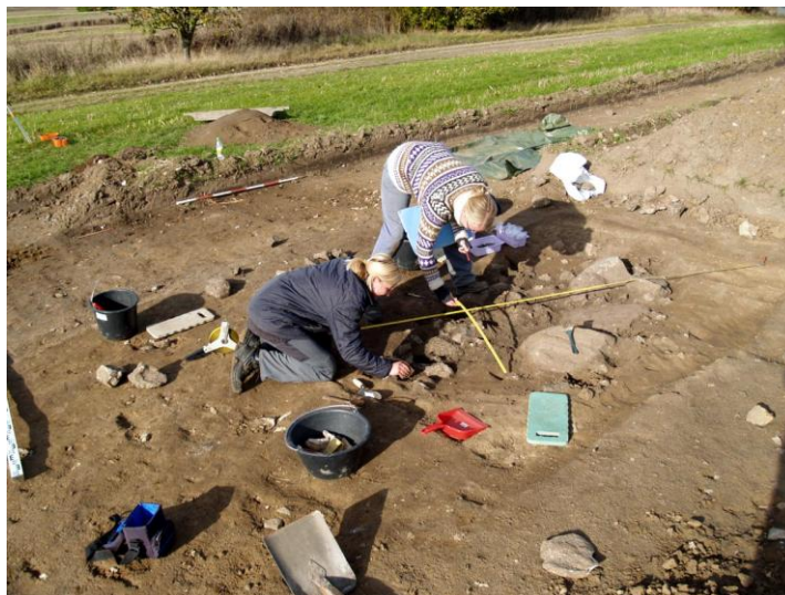
Udgravning og opmåling af grav A 505.