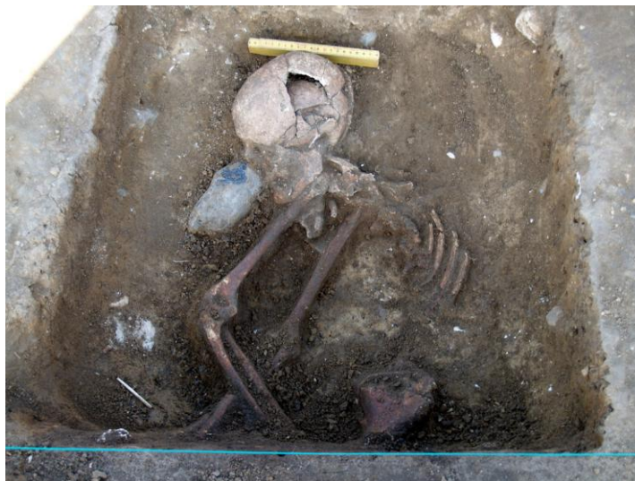
Grav A 292, nedre begravelse, kvindegrav.

Begge synes lagt i plausibel anatomisk korrekt orden, den øverste dog med et forstyrret eller søndret kranie. Begge mangler i udtalt grad underkstremiteter hvilket må skyldes svingende bevaringsforhold. Begravelsen antages at kunne dateres til vikingetid.