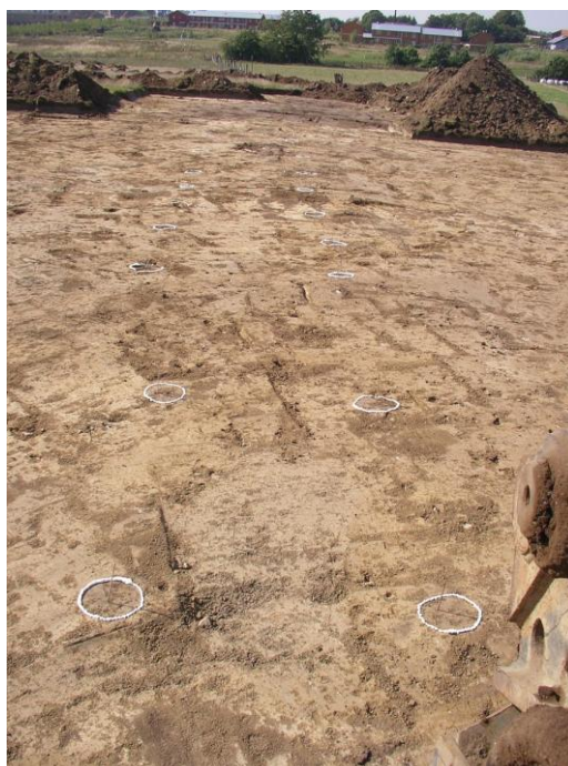
Staklade, langhus og mørkt udsmidslag bagerst. Stolperne er markeret med barberskum.

Keramik fra udsmidslaget kan dateres til ældre jernalder, sandsynligvis yngre romersk jernalder. Husets typologi kan antyde samme datering.