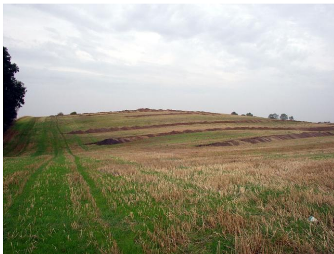
Grydehøj med søgegrøfter, set fra sydøst.

I foråret 2005 er der bl.a. med metaldetektor opsamlet flere dele af bronzesværd fra sønderpløjede grave fra ældre bronzealder ca. 1800-1000 f. Kr, samt et fragment af hulsleben flintøkse fra senneolitikum ca. 2400-1800 f. Kr.