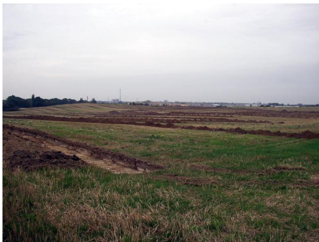
Etape II, set fra nordøst. I baggrunden højden med Grydehøj.

På område 26 sås på 4-5 mindre morænebakkeøer, små åse og plateauer spor af egentlig bosættelsesaktivitet i søgegrøfterne. På den nordlige del af etape II blev der derfor foretaget udvidede undersøgelser på 4 områder, 1-4, på hhv. 1500, 750, 1550 og 1150 m 2 . På område 1,3 og 4 fandtes hvert sted spor af én gårdsenhed bestående af omtrent 3 samtidige langhuse, hvor de kraftigste bygninger tolkes som beboelseshuse og de øvrige mindre huse som økonomibygninger. Flere af husene ses i to faser. Der ses enkelte steder spor af hegn samt tilstedeværelse af kogestensgruber. De små gårdskomplekser ligger alle på små åse og plateauer, naturligt afgrænset af et landskab domineret af små og store vådområder, søer og moser. Gårdene dateres indenfor romersk jernalder. En lignende gårdsenhed nær område 1, 3 og 4 undersøgte i 1984 forud for HNG's gasledning. Der ses ikke spor af senere – eller tidligere – gårde. Området på etape II har således kun været beboet én gang. Vådområderne har begrænset udnyttelsen og udbyttet af et agerlandskab, hvilket kan være årsagen til, at man ikke senere i oldtid eller middelalder har slået sig ned i området. Først i historisk tid hvor dræning og afvanding begyndte, har gårde haft et fundament til at opstå i området igen.