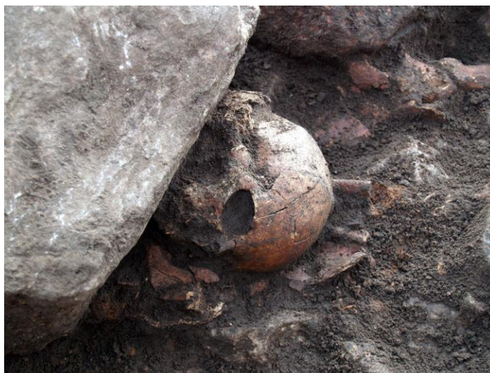
Grav A 505. Kranie af yngre kvinde, kilet ind under kampesten.

Ovenpå og bag personens hoved samt hestens krop blev derpå lagt 4 store kampsten, en fjerde sattes på vestsiden. Ovenpå det hele dumpedes en stor mængde kraftige flinteskærver samt mindre marksten som tildækning. Samtidig med stenspækningen blev der smidt søndrede dele af en yngre kvinde samt dele af en søndret hund. Delene er brøkket totalt ned mellem stenene, bl.a. er kraniet kilet ind under en kampesten.