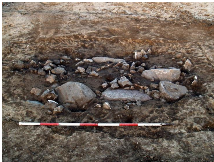
Grav A 505, øvre lag. Der ses stenpakning og søndrede knogler.

Der er tilsyneladende tale om en venstresidet hockerbegravelse, ud fra positionen af bevarede dele af lår- og skinneben samt arme. Selve kraniet var totalt bortpløjet, det har ligget omtrent ud for et pløjesor. Der sås ingen spor af kistekonstruktion. Der fandtes intet gravgods. Graven er udateret – vikingetid?