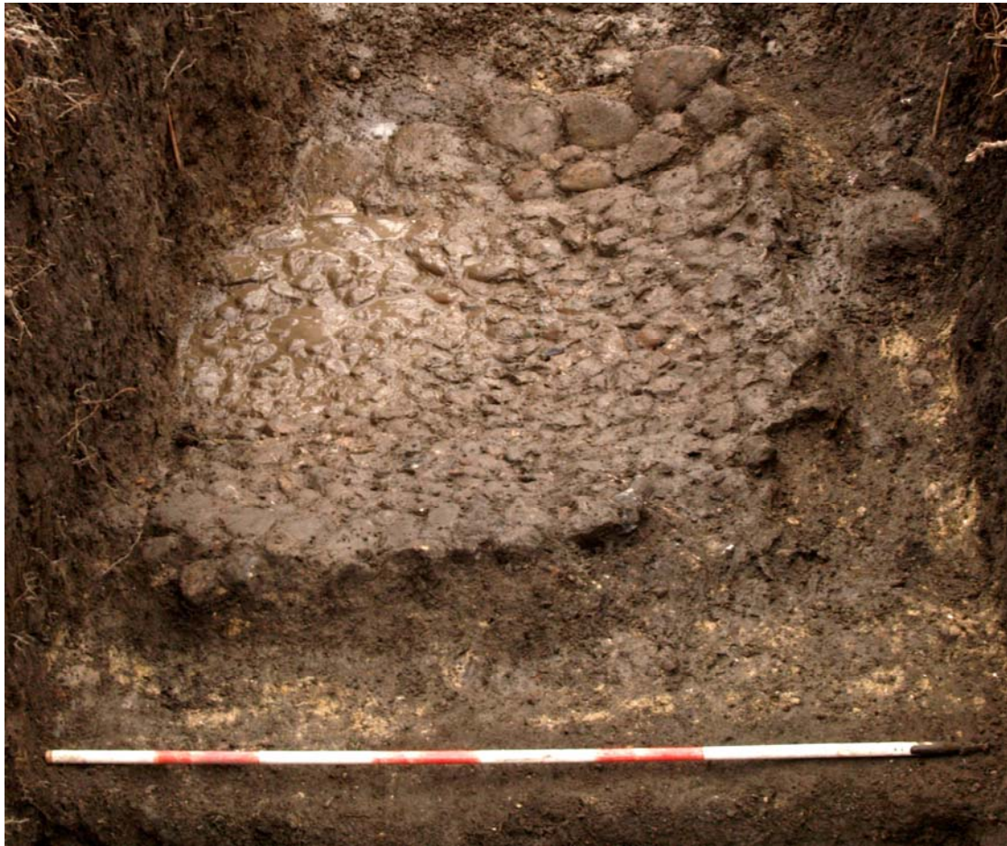
Stenlægningen A9. Set fra nord.

jernsøm/jernbeslag. Keramikken kan generelt dateres til middelalder. Om stenlægningen er en del af et vejforløb, en gårdsplads eller eventuelt en gulvbelægning, kan ikke umiddelbart afgøres.