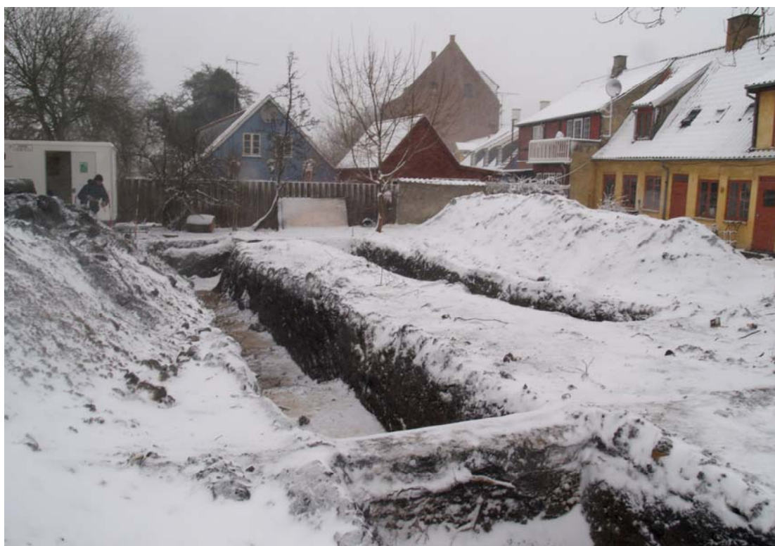
Udgravningen under snefald i februar. Set fra syd.