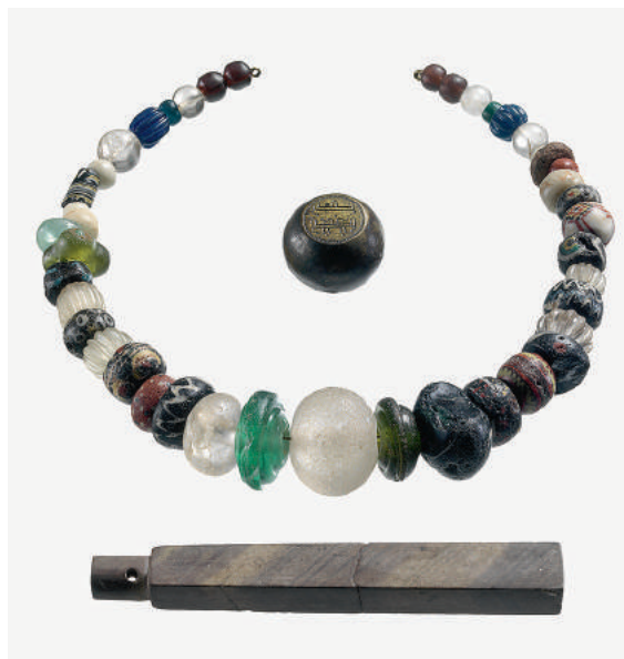
Fig. 3. Perlekæde og vægtlod fra Lejreskatten. Vægtlodet vejer ca. 200 gram. Det består af en jernkerne, som er overtrukket med en kobberlegering. På fladen bærer det en efterligning af arabisk skrift.