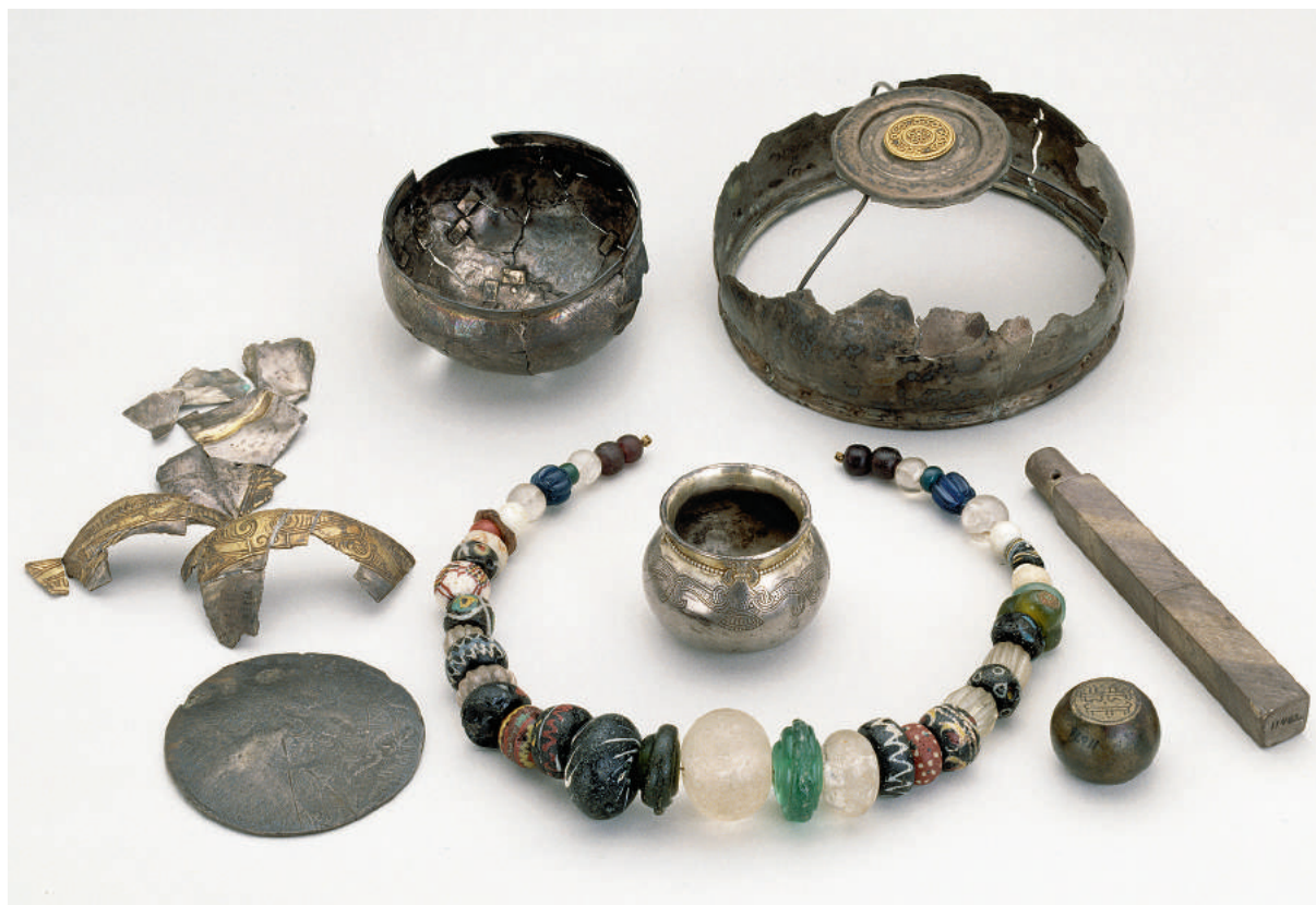
Fig. 1. Lejreskatten afviger fra flertallet af de danske vikingetidsskatte ved fundets meget forskellige genstandsformer. Almindeligvis består datidens sølvskatte af ituhuggede sølvsmykker og mønter. I kun en lille gruppe skattefund indgår sølvskåle.

Lejreskatten, der, siden den blev fundet for 160 år siden, har levet et forholdsvis anonymt liv blandt vikingetidens mere berømte fund, skønt både genstandene og fundhistorien er ganske spændende.