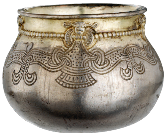
Fig. 2. Det lille fine sølvbæger bærer under randen en forgyldt frise med fire kvindefigurer. Der kan meget vel være tale om fremstillinger af frugtbarhedsgudinden Freja.