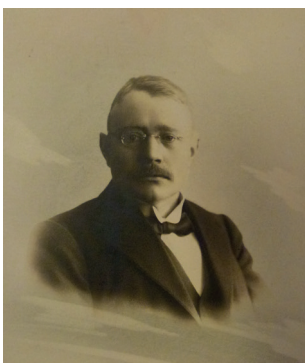
Fig. 3 Othar Lützhøft Roskilde Lokallhistoriske Arkiv.

franskmændenes bombardement af Casablanca samme år, en forestilling, som fik mange anmelderroser for sine gode, stabile og lysstærke billeder. 68