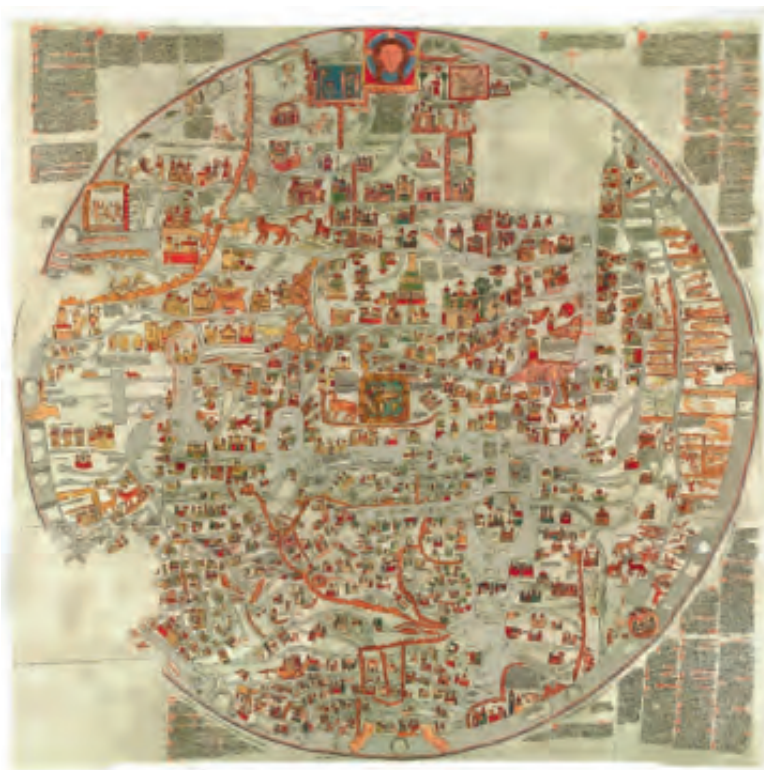
Fig. 3. Ebsterkortet (reproduktion), 1200-tallet. Det enorme kort målte 3,57 m i bredden og var det største Mappa Mundi, som overlevede middelalderen. Det blev ødelagt under de allieredes bombing af Hannover i oktober 1943. Efter http://weblab.uni-lueneburg.de/kulturinformatik/projekte/ebsterkart/content/start.html .

Helt grundlæggende er det væsentligt at understrege, at såvel placering, bygning og udsmykning af en kirke aldrig var et udtryk for tilfældighed, dertil var den alt for vigtig. 7 Det er derfor påfaldende, hvorledes ens opmærksomhed på stor afstand fanges af Sankt Laurentii Kirkes beliggenhed. Det er derfor nærliggende at søge at indkredse, hvilke overvejelser der kan ligge bag denne placering.