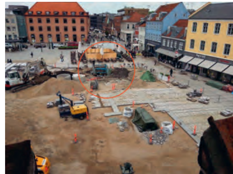
Fig. 7. Udgravningsfelt set fra Sankt Laurentii Kirkes tårn. I belægningen markeres kirkens omrids. Foto Tonny Engelsted Petersen, 2015.

Den lyse, antageligvis hvidkalkede, kirkes kontrast til de mere jævne omgivelser, gav den desuden en meget dominerende position i det urbane landskab. Især i ældre middelalder må dette have været særligt iøjefaldende, da Roskildes urbane bebyggelsesstruktur på denne tid var præget af træ som enerådende byggemateriale ved opførelse af både boliger, hegn, plankeværk og vejforløb m.m. Stofligheden i byggematerialet betød endvidere kirkens karakter af noget permanent og overjordisk, hvilket i høj grad var i overensstemmelse med ønskerne til en bygning, som skulle huse religiøse handlinger. 9