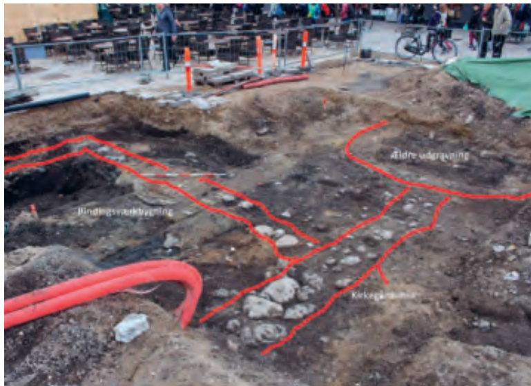
Fig. 9. Bindingsværksbygning og kirkegårdsmur. Foto Claus Rohden Olesen, ROMU, 2015.

Efterfølgende opførtes tillige en mindre bindingsværksbygning, anlagt på stensyld. Denne bygning, der blev rejst op ad kirkegårdsmuren vinkelret ud fra denne, overlejlrede brønden. At den blev påbygget kirkegårdsmuren giver en forholdsvis snæv er dateringsramme for dens opførelse, idet de skriftlige kilder fortæller, at byens borgere plyndrede og ødelagde Sankt Laurentii Kirke i 1531, hvorefter den blev nedbrudt og området udlagt til torv. 14 Fundmaterialet antyder imidlertid, at bygningen overlevede kirkens nedbrydning. Dette understøttes af Resens kort fra 1673, der afbilder en