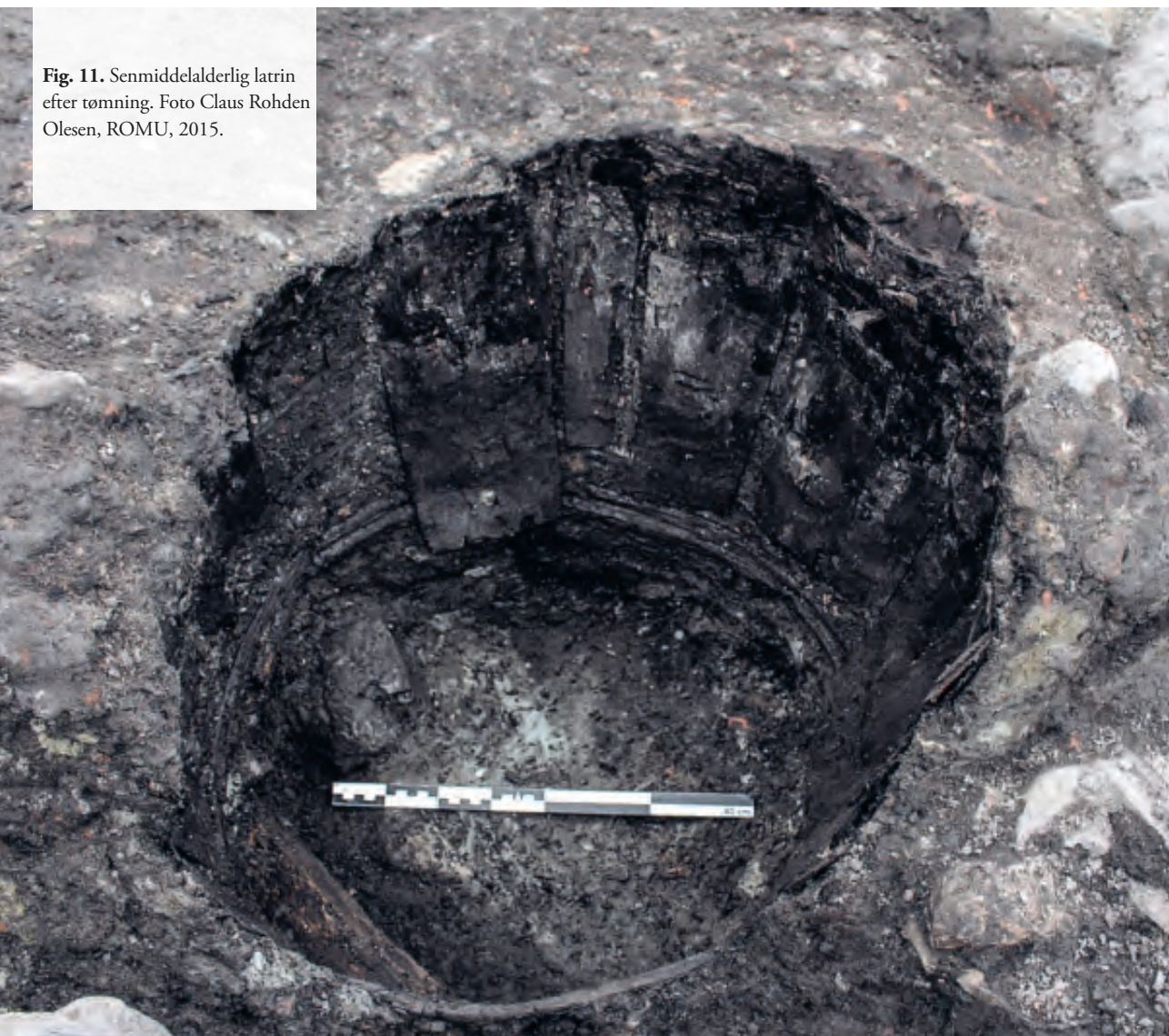
Fig. 11. Senmiddelalderlig latrin efter tømning.

På bygningens sydside blev der imidlertid fundet tre fyldte latrintønder. Stratigrafien godtgjorde, at de var nedgravet efter bygningens opførelse, hvorfor det må formodes, at de har befundet sig under tag i en let trætilbygning. Spor af en sådan træbygning er da også muligvis påtruffet i udgravningens sydprofil, idet der her blev fundet en træstolpe, som dog ikke kunne frilægges i tilstrækkelig grad til, at de stratigrafiske relationer kunne udredes og prøver udtages til dendrokronologisk analyse. De dendrokronologiske analyser af selve latrintønderne viser derimod, at den ældste er fremstillet efter 1467, medens de to yngre er dateret til efter henholdsvis 1505 og 1518. Afhængig af sliddet må tønderne antages at have en forholdsvis kort levetid, hvorfor dateringerne umiddelbart synes at indplacere dem i tiden mellem bygningens opførelse og nedbrydningen af Sankt Laurentii Kirke. Det er dog vigtigt at holde sig for øje, at ingen af tønderne fra de to ældste tønder havde splintved bevaret, samt at den yngste tønde var fremstillet af bøg. 15 Det kan derfor ikke siges med sikkerhed, hvornår træet, der indgår i tønderne, er fældet.