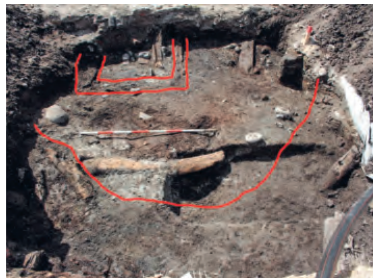
Fig. 8. Den senmiddelalderlige brønd på Stændertorvet, set fra øst. Brøndkasse og grube er markeret med rødt. Foto Claus Rohden Olesen, ROMU, 2015.

Brøndkassen var gravet dybt ned i undergrunden og bevaret i en samlet højde på over 3 m, mens de dele, som i brugstiden befandt sig i gadeniveau, ikke var bevarede. Der kan således ikke siges noget om, hvorledes byens borgere har betjent sig af brønden, men dens beliggenhed centralt på en af byens mest trafikerede pladser sammenholdt med anlægsarbejdets omfang efterlader ingen tvivl om, at byens øvrighed må have stået bag. Der blev ikke fundet genstande tabt i brønden, som kunne give en idé om, hvornår den blev bygget, og hvor længe den nåede at være i brug. Ni stykker tømmer fra den indre trækonstruktion blev imidlertid udvalgt til dendrokronologisk analyse med henblik på at fastslå byggetidspunktet. I den forbindelse var især fældningstidspunktet for hjørnestolpernes træ interessant, idet der ikke kunne påvises spor af genbrug på dem. Fæld-