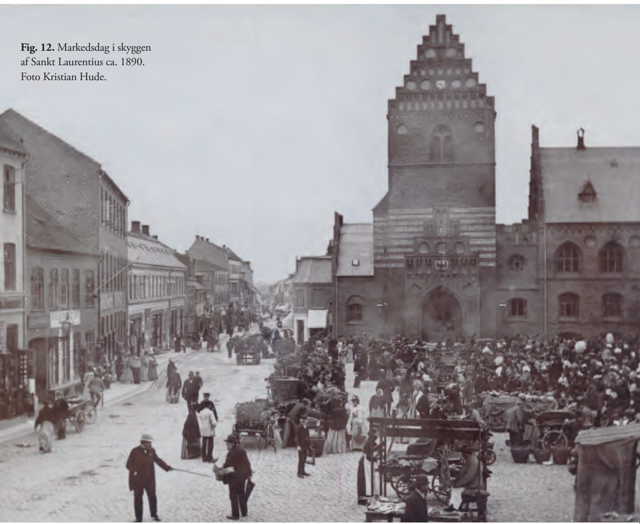
Fig. 12. Markedsdag i skyggen af Sankt Laurentius ca. 1890.