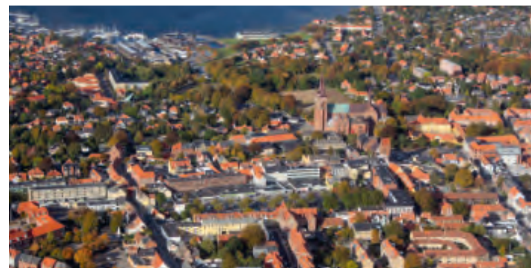
Fig. 1. Roskilde bymidte set fra luften. Foto Cille Krause, ROMU, 2009.

Stadig den dag i dag toner synet af Sankt Laurentii Kirketårn, der hæver sig op over de omkringliggende bygninger, frem i det fjerne allerede ved ankomsten til østenden af Algade. Dens kamtakkede gavl med sine sengotiske blændinger, der krones af tre etagedelte trappestik og leder tankerne i retning af Den Hellige Treenighed, forrykker således opfattelsen af at befinde sig i den religiøse periferi hen imod en oplevelse af øget nærvær med det guddommelige. 1