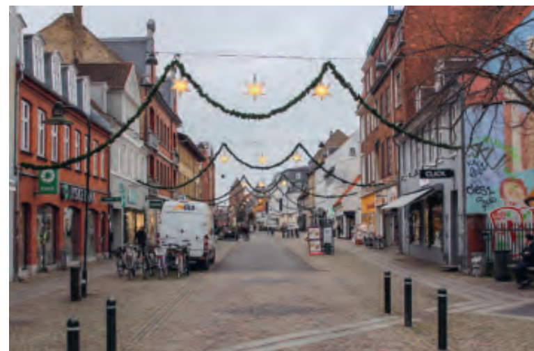
Fig. 4. Sankt Laurentii Kirkes tårn i horisonten. Foto Jesper Langkilde, ROMU, 2015.

Hvis Roskildes 14 middelalderlige sognekirker indtegnes på et bykort, anskueliggøres det, at næsten samtlige rejst inden for voldene er beliggende meget tæt på eller helt ud til gaden. I andre danske bispebyer, heriblandt Lund og Odense, synes samme overordnede tendens at kunne spores. Da hovedparten af Roskildes middelalderlige sognekirker blev nedbrudt i tiden omkring Reformationen, artikuleres deres nære relation til det offentlige rum ikke i det nuværende gadebillede. Den tætte relation mellem kirkerummet og det offentlige rum kan imidlertid fortsat iagttages i Sydeuropa, hvor mange, mindre, middelalderlige sognekirker ses kilet ind mellem de høje, sammenvoksede rækker af bygninger, der ligger langs gaden i byer som Siena og Firenze. Fælles for disse er den lette adgang fra gaden til daglige, kirkelige handlinger og sjælesorg. I ndplaceringen af Sankt Laurentii Kirke i denne kontekst, er der næppe tvivl om, at den kirkelige betjening af de færdende på torvet var en vigtig del af kirkens arbejde. Spørgsmålet er imidlertid, hvorvidt dette hensyn blev taget, da kirkens spektakulære placering blev valgt?