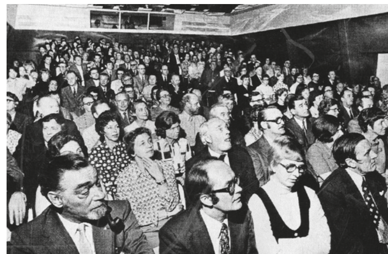
Fra indvielsen af Ungdommens Hus