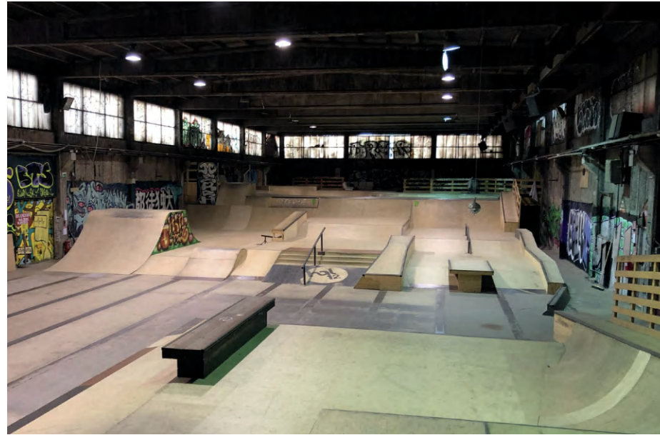
← Fig. 8. Bowlen i Hal 12, fotograferet i oktober 2022. Foto: Cille Krause. ↗ Fig. 9. U-rampen, i hallens ene hjørne, fotograferet i januar 2023 Foto: Cille Krause. ← Fig. 10. Hallen set fra nord, fotograferet i januar 2023. Foto: Cille Krause. ↘ Fig. 11. Hallen set fra syd, fotograferet i januar 2023. Foto: Cille Krause.