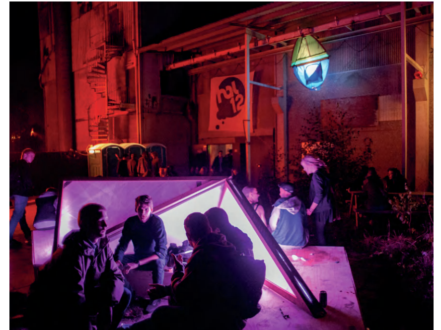
↑ Fig. 5. Fra et af de mange events, der blev afholdt i Hal 12, september 2010.