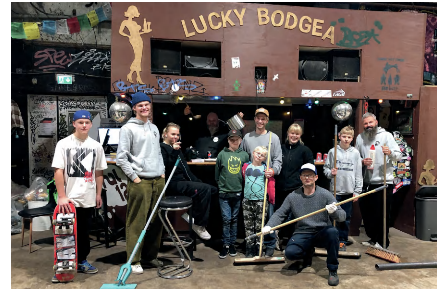
↑ Fig. 12. Frivillige stiller op til hovedrengøring af hallen uden for åbningstid (november 2022).

”Hallen er kun en realitet på grund af det frivillige arbejde.”