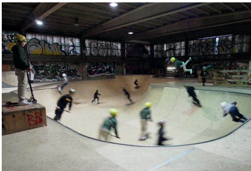
↑ Fig. 13. Mens skatelivet er sæsonbestemt i Rabalderparken, fortsætter "den vilde sjæl" indendørs i vinterhalvåret.

der nu mangler, er kvarteret omkring Hal 12. Da Unicon forlod industrigrunden, var det området omkring Hal 12, der først blev taget i brug af de nye aktører, herunder skaterne. Med den vedtagne lokalplan og det fremtidige byggeri på industrigrunden bliver dette areal det sidste, der står færdigudviklet og bebygget. 9