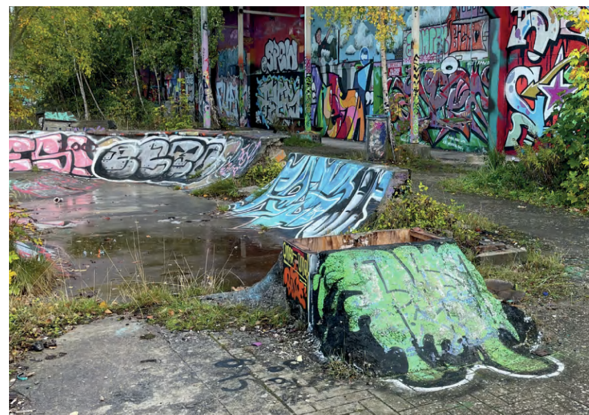
↓ Fig. 15. Ældre ramper udenfor hallen. Planen er, at der skal bygges parkeringshus her.