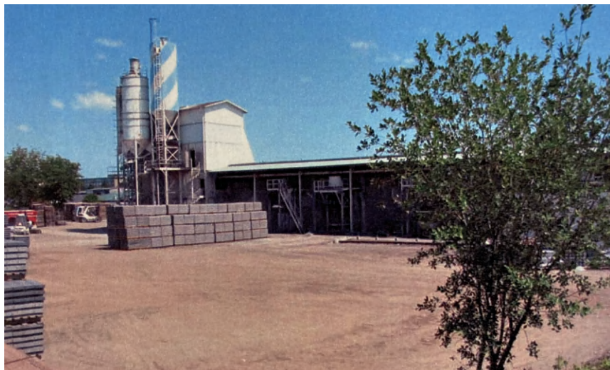
↑ Fig. 1. Hal 12 fotograferet i 2003. Bemærk det karakteristiske tårn på nordgavlen, hvor de frivillige brød ind og fik adgang til toiletforhold. 2