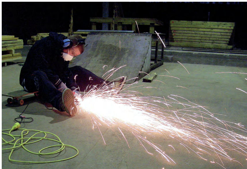
↓ Fig. 3. Det frivillige arbejde er i fuld sving, januar 2007.

Noget af det, der også kom ud af det frivillige arbejde i hallen, var, at mange af de unge, der deltog, via arbejdet fandt "deres rette hylde". Mange kom i kontakt med håndværksmæssigt, økonomisk og socialt arbejde, og det har hjulpet de unge med at forme deres vej – de har simpelthen prøvet nogle ting af undervejs og er blevet klogere på sig selv. Dette gjorde sig især gældende i de første par år, hvor aktiviteten var stor og byggedagene mange.